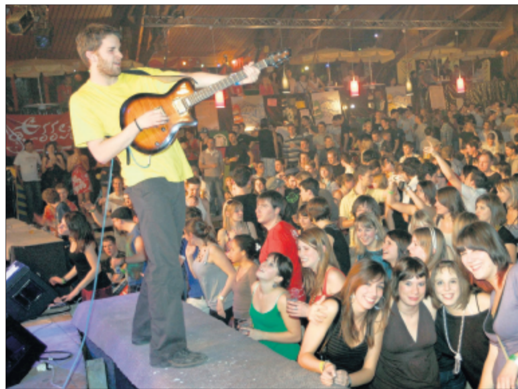
Le groupe Ska Nerfs transmettra toute l'énergie et la fougue jurassienne sur les bords du lac Léman.